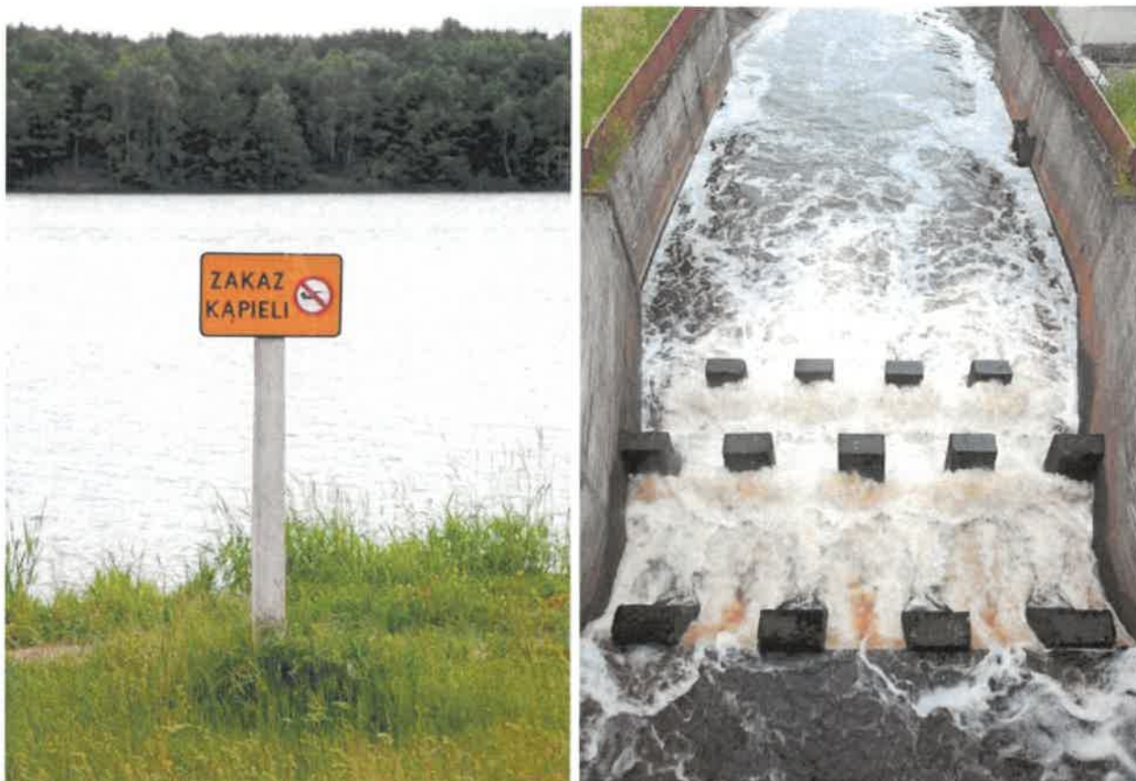
Fotografia 6 Tabliczka informacyjna na brzegu zbiornika i fragment zapory

Na terenie zalewu utworzone zostały miejsca biwakowe, dla wędkarzy, miejsce okazjonalnie wykorzystywane do kąpieli i parkingi. Funkcja retencyjna powstałego zbiornika jest ograniczona ze względu na zbyt małą pojemność powodziową obszaru wodnego. Wokół zalewu utworzona została Ścieżka Edukacyjno – Wypoczynkowa o długości ok. 3,5 km, której fragment prowadzi przez historyczny Królewski Trakt Piastowski. Ścieżka została wyposażona w miejsca do odpoczynku z ustawionymi tablicami edukacyjnymi zawierającymi informacje o funkcjach lasu, okolicznej szacie roślinnej, zwierzętach, organizmach żywych, działalności człowieka na terenach leśnych i uwarunkowaniach przyrodniczych.