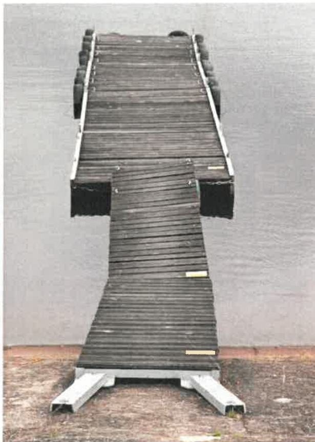
Fotografia 5 Tabliczka informacyjna umieszczona na zaporze zbiornika i drewniany pomost