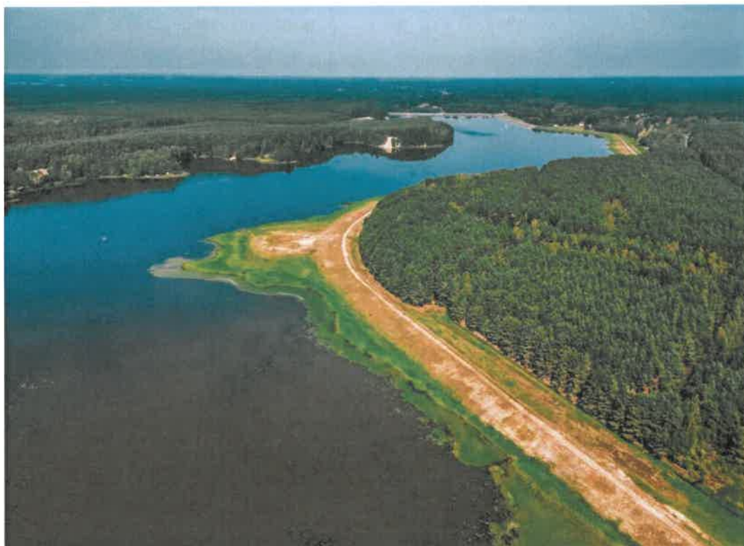
Fotografia 3 Zalew Maziarz w Wilczej Woli

i zaopatrzenia w wodę, a komponując się z otaczającym krajobrazem podwyższa różnorodność środowiska, atrakcyjność oraz walory estetyczne i krajobrazowe.