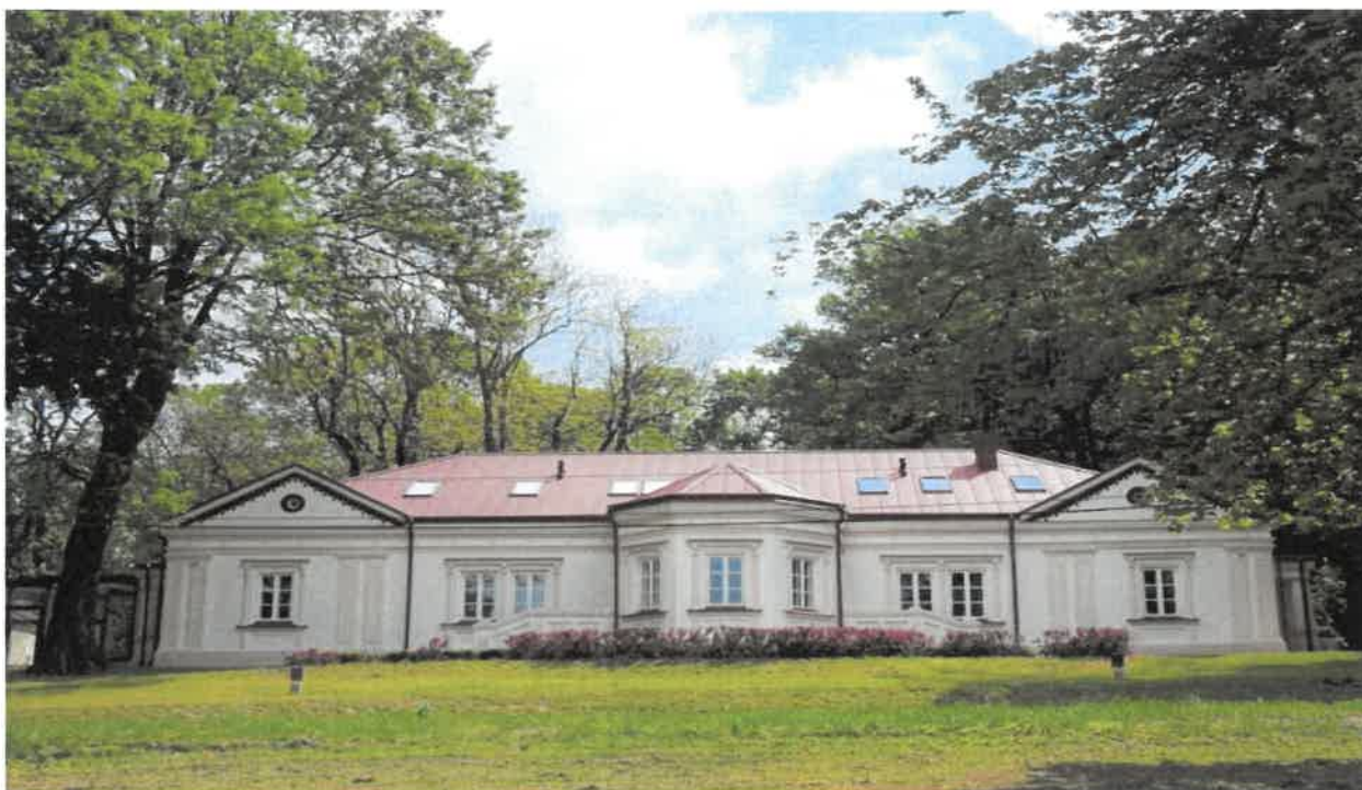
Fotografia 2 Dworek Błotnickich w Dzikowcu

W Dzikowcu usytuowany został w I poł. XIX w. murowany, późno klasycystyczny parterowy dwór, zabudowania dworskie otoczone zabytkowym parkiem angielskim z centralnie położonym stawem, tarasem widokowym, chronioną roślinnością, starodrzewem i kapliczką ze Św. Janem Nepomucenem z poł. XVIII wieku. W parku występuje wiele rzadkich gatunków drzew z najlepiej zachowaną aleją tujową i grabową. Drzewostan obejmuje oznaczone cztery pomniki przyrody: lipa szerokolistna, jesion wyniosły oraz dwa dęby szypułkowe. Zespół Parkowo – Dworski Błotnickich w Dzikowcu odznacza się szczególnymi wartościami estetycznymi, kulturowymi i dydaktycznymi. W 1816 roku wybudowany został kościół pw. Św. Mikołaja w późno barokowym stylu.