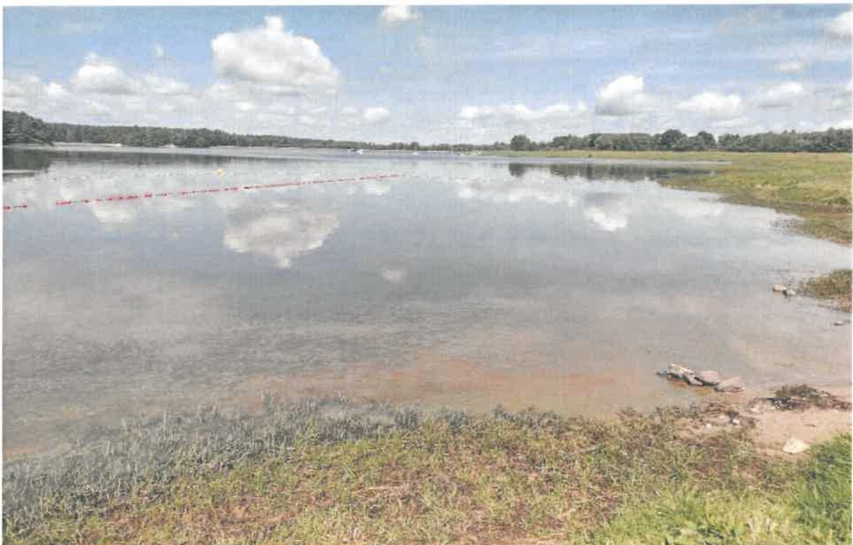
Fotografia 14 Widok zalewu na miejsce okazjonalnie wykorzystywane do kąpieli