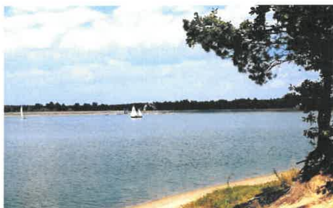
Fotografia 9 Widok na zbiornik