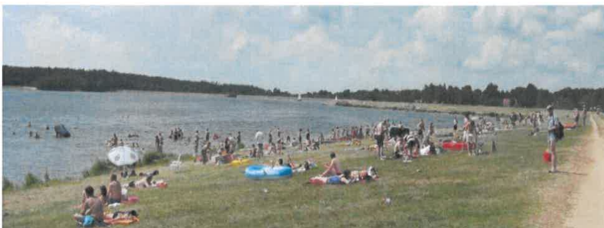
Fotografia 7 Fragment brzegu zbiornika z wałem ziemnym

Na terenie zalewu utworzone zostały miejsca biwakowe, dla wędkarzy, miejsce okazjonalnie wykorzystywane do kąpieli i parkingi. Funkcja retencyjna powstałego zbiornika jest ograniczona ze względu na zbyt małą pojemność powodziową obszaru wodnego. Wokół zalewu utworzona została Ścieżka Edukacyjno – Wypoczynkowa o długości ok. 3,5 km, której fragment prowadzi przez historyczny Królewski Trakt Piastowski. Ścieżka została wyposażona w miejsca do odpoczynku z ustawionymi tablicami edukacyjnymi zawierającymi informacje o funkcjach lasu, okolicznej szacie roślinnej, zwierzętach, organizmach żywych, działalności człowieka na terenach leśnych i uwarunkowaniach przyrodniczych.