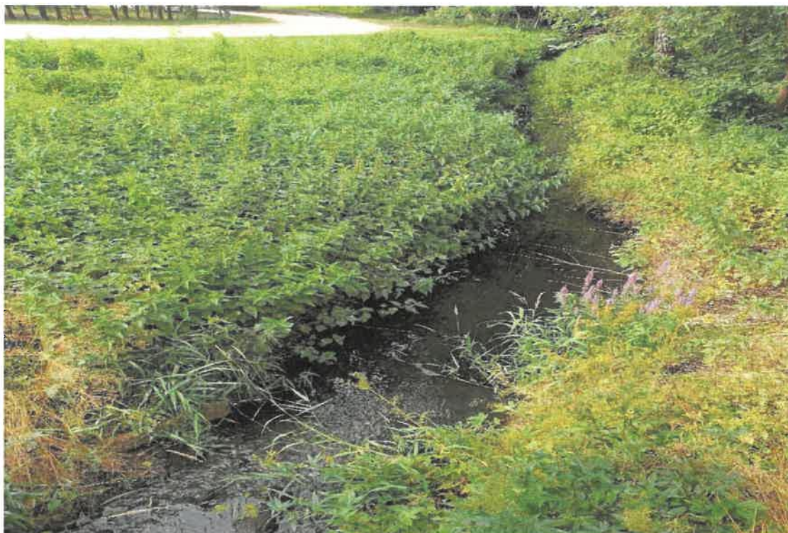
Fotografia 11 Potok Olszowiec