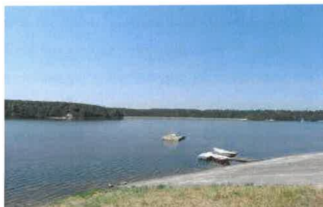
Fotografia 10 Widok na strefę brzegową