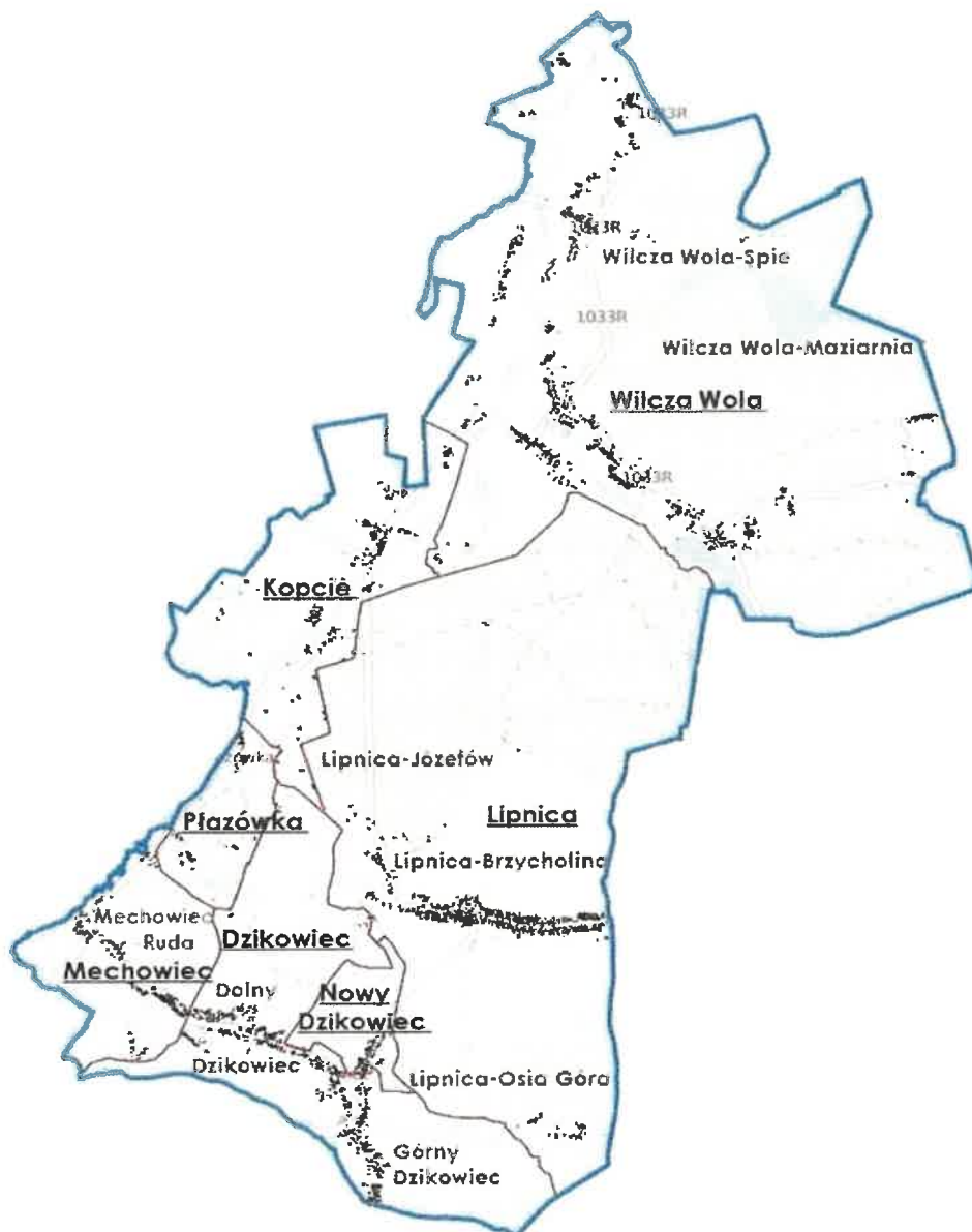
Fotografia 1 Mapa Gminy Dzikowiec z podziałem na sołectwa

Sposób zagospodarowania terenu gminy wykazuje zróżnicowanie warunków naturalnych i zabudowań. Zróżnicowanie wysokości w obszarze gminy dochodzi do około 60m. Tereny rolnicze i leśne mają charakter naturalny o powiększającej się powierzchni zalesionej, której podstawowym gatunkiem jest sosna zwyczajna stanowiąca 70% powierzchni drzewostanu. Północne krańce gminy obejmuje rezerwat leśno – krajobrazowy „Wilcza Wola” z obszarami leśnymi, pozostałymi terenami zielonymi, działkami i stawami użytkowanymi w celach hodowlanych z licznymi gatunkami fauny, ptaków wodnych i szaty roślinnej. Teren obszaru Gminy Dzikowiec cechuje się dużą bioróżnorodnością, naturalnością krajobrazu i dobrym stanem czystości środowiska.