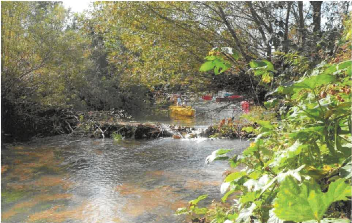
Fotografia 9 Rzeka Łęg

Rzeka Łęg jest to rzeka nizinna – tworzy naturalną część wód, której zlewnia jest monitorowana. W Gminie Dzikowiec, zlokalizowana jest na terenie wsi Wilcza Wola i Spie. Zaliczana jest do JCWP zagrożona ryzykiem nieosiągnięcia celu środowiskowego, którym jest m.in. dobry stan ekologiczny, Nie jest ona przeznaczona do spożycia przez ludzi.