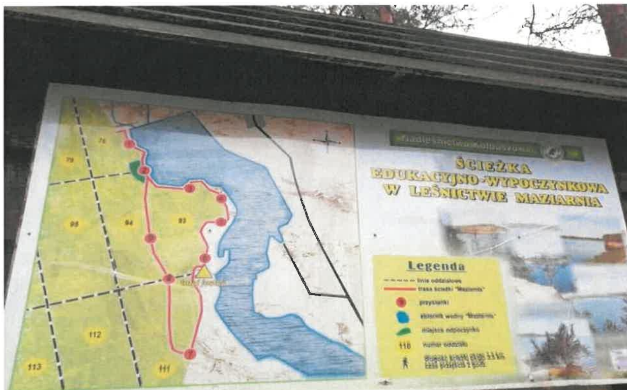
Fotografia 8 Tablica informacyjna Ścieżki Edukacyjno-Wypoczynkowej