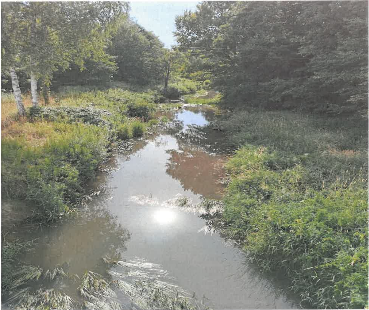
Fotografia 10 Rzeka Przyrwa

Dopływy tych dwóch rzek tworzą potoki lub strumienie nizinne piaszczyste. Wszystkie z nich są zagrożone ryzykiem nieosiągnięcia określonego celu środowiskowego oraz ich wody są niezdatne do spożycia przez ludzi. Różnią się od siebie m.in. długością, szerokością, głębokością oraz lokalizacją: