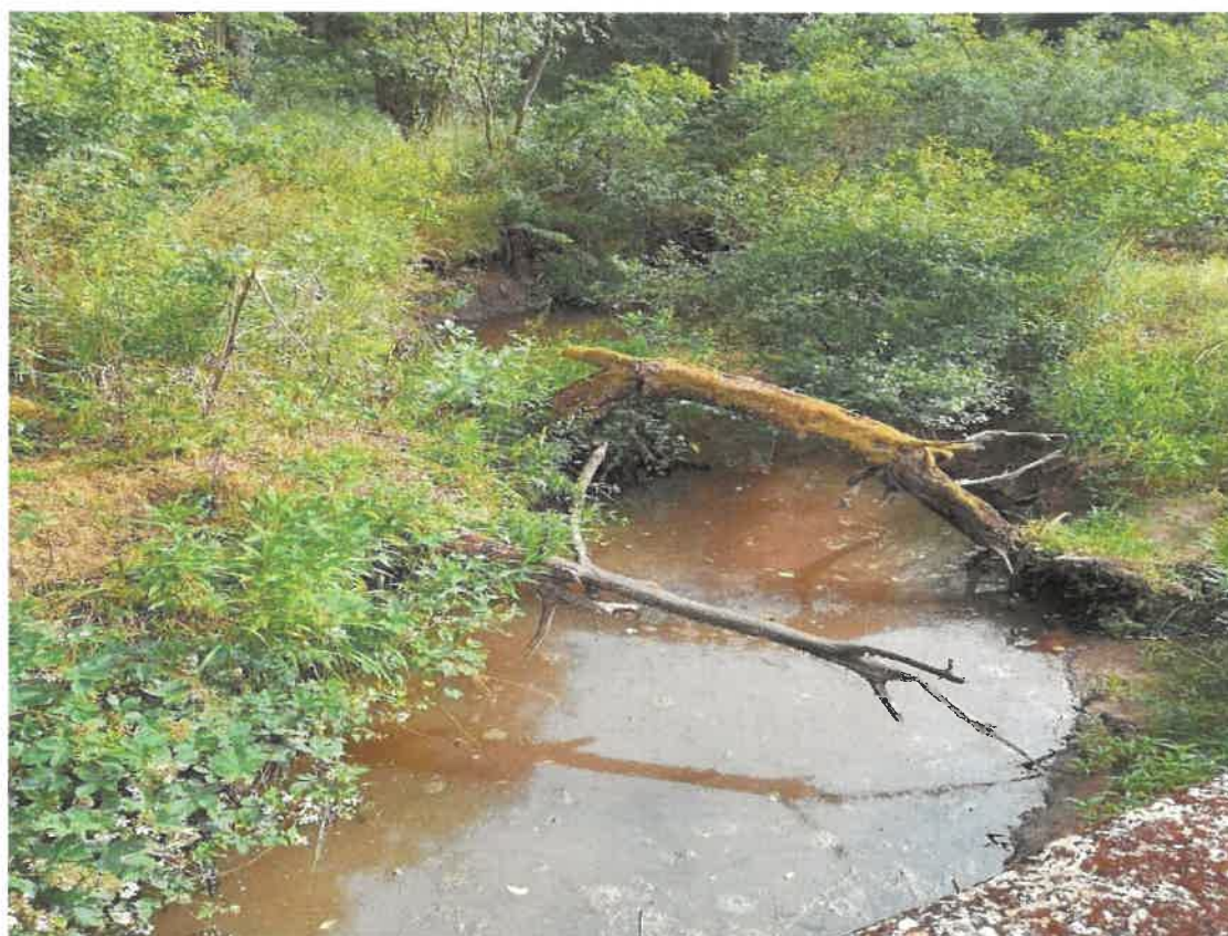
Fotografia 12 Potok Olszówka