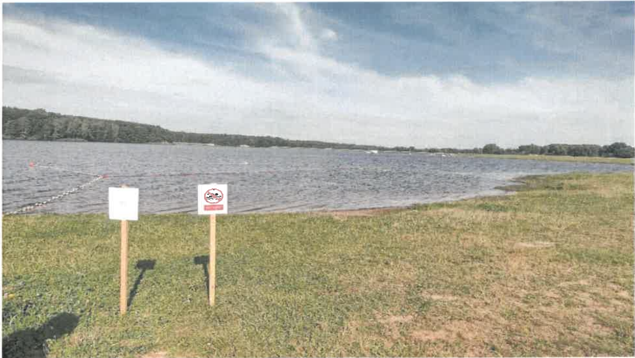
Fotografia 13 Widok zalewu z bojami i tabliczkami