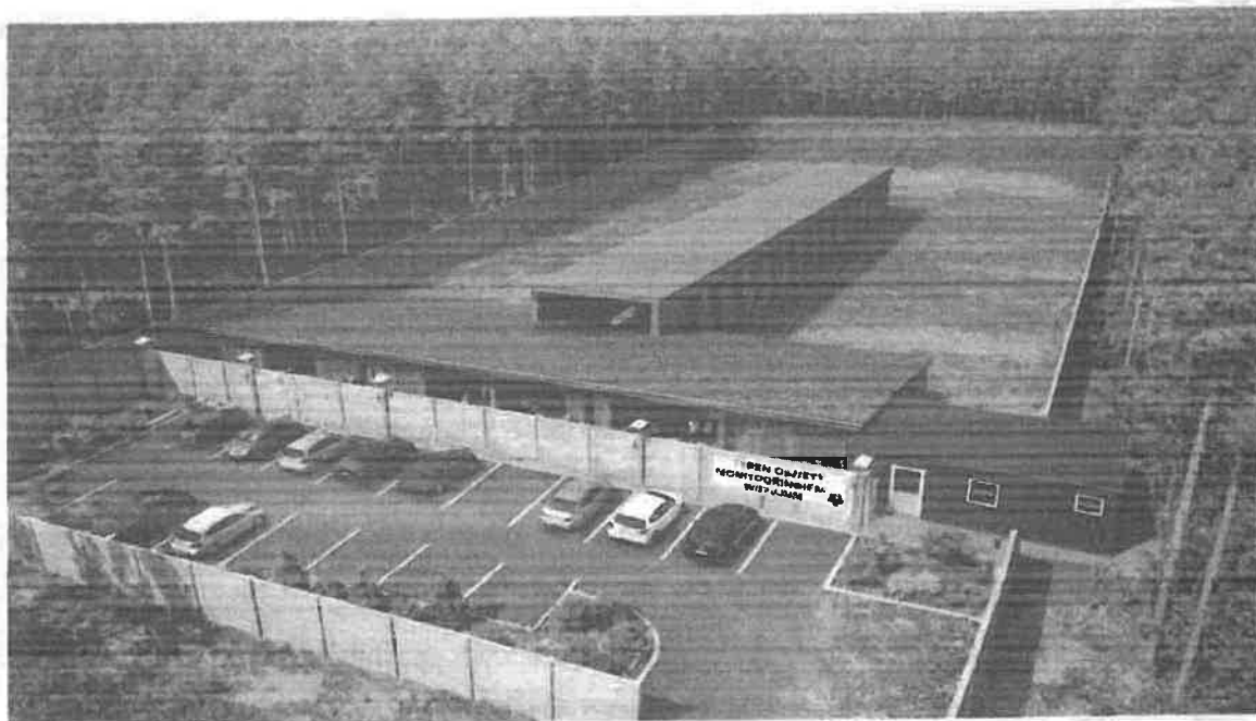
WIZUALIZACJA WYŁĄCZNIE POGLĄDOWA

Co więcej każda strzelnica, w tym ta projektowana musi posiadać czytelny regulamin, plan obiektu z oznaczeniem stref bezpieczeństwa, dróg ewakuacyjnych i punktów pomocy, a także system rejestracji osób korzystających. Tak kompleksowy system organizacyjny gwarantuje pełną kontrolę nad przebiegiem wszystkich aktywności na strzelnicy.