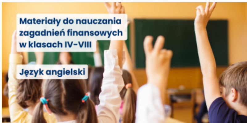
Materiały do nauczania zagadnień finansowych w klasach IV-VIII język angielski